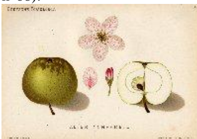
W.Lauche, 1882/83, Deutsche Pomologie, Berlin.

SYNONYMES : Nonpareille (Chaillou, Catalogue..., 1755- Duhamel, traité des arbres fruitiers, 1768, t.1, p.313)- Reinette Nonpareille (Hermann Knoop, 1740, n° 13, pl.9, Pomologie et 1771, pp.51 et 132)- Reinette Sans Pareille(1776)- Old Nonpareil(1831, Angleterre)- Duc D'Arsel(1842, Londres)- English Nonpareil(d°)- Hunt's Nonpareil- Loveden's pippin(d°)- Nonpareille d'Angleterre(d°)- Sans Pareille(Angers, 1844)- Grune reinette(Hennau, Annales de pomologie belge et étrangère, 1856, t.4, p.53 et réédition 1998, pp.433/36)- Original Nonpareil(d°)- Alter Nonpareil(W.Lauche, 1882, Deutsche pomologie, n°68).