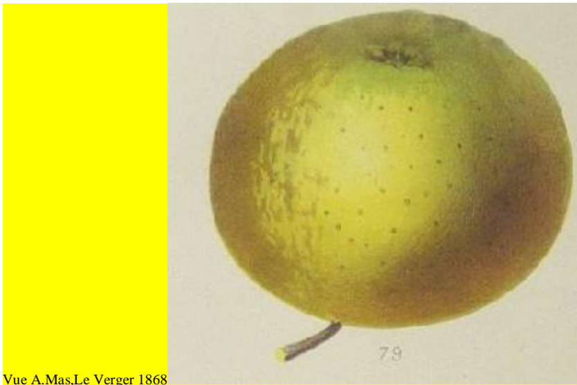
Vue A.Mas, Le Verger 1868

ORIGINE : France, 16 e siècle. Propagée par le pépiniériste Chaillou de Vitry-sur-Seine dès 1755 et, plus tard, par les pépinières Leroy d'Angers. Conservée à Brogdale, (the book of apples, 1993, p.240).